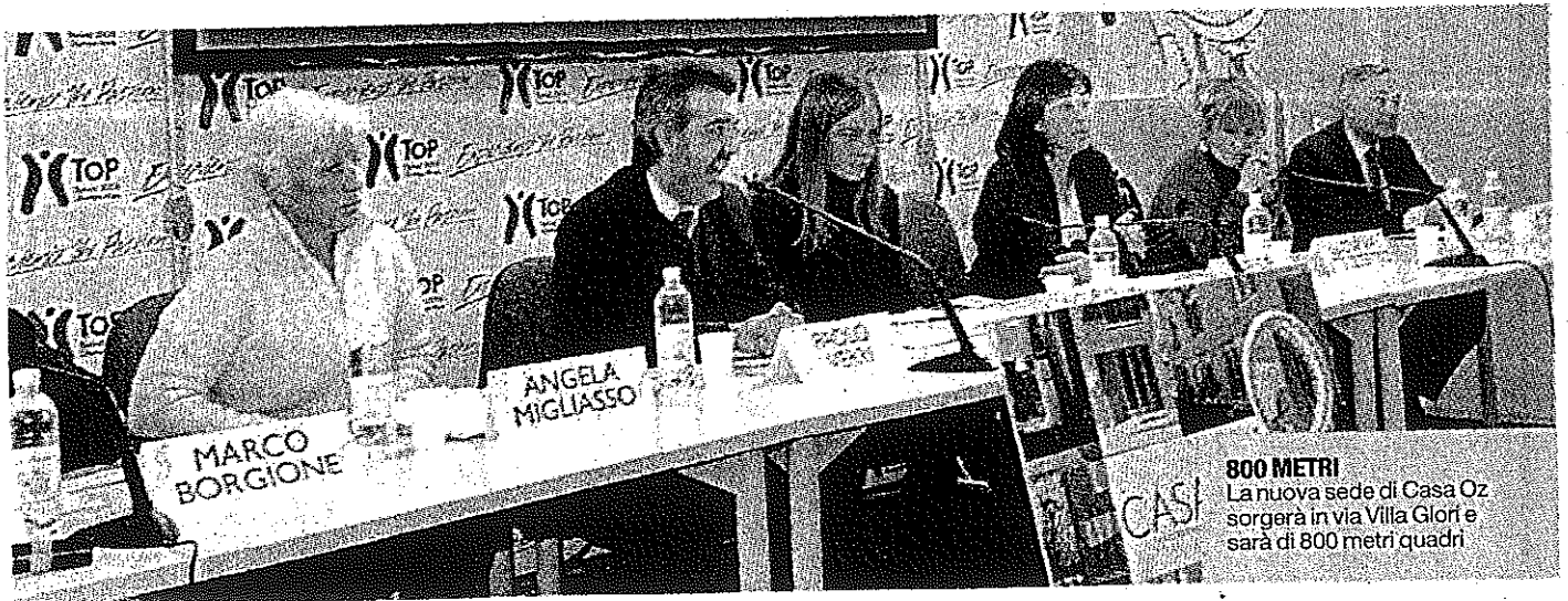
800 METRI La nuova sede di Casa Oz sorgerà in via Villa Glori e sarà di 800 metri quadri

riesca più a occuparsi del resto. Così, i fratellini sani dei bambini malati possono passare qui parte del tempo mentre la madre sono impegnate in ospedale. Educatori professionisti seguono i ragazzi che ne hanno bisogno, mentre assistenti sociali si occupano di aiutare chi non riesce a districarsi nelle trafale burocratiche necessarie a ottenere tutto il sostegno possibile». Già oggi, Casa Oz è ospite del Comune, in uno spazio ricavato nel villaggio olim-